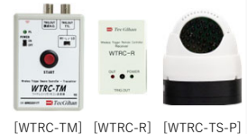
[WTRC-TM] [WTRC-R] [WTRC-TS-P]

IMS-SD間、IMS-SDと外部機器の記録タイミングを合わせるための赤外線TIRG発信機です。ボタン押下と同時に赤外線TRIG、TTL±を発信します。強力赤外線発光ユニット(WTRC-TS-P)、赤外線TRIGを受信して接点信号出力する子機(WTRC-R)もあります。